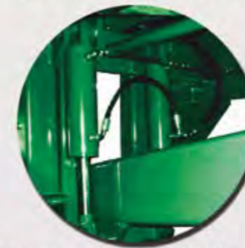
AMORTIGUACIÓN LANZA HIDRÁULICA FLÈCHE AVEC SUSPENSION HYDRAULIQUE