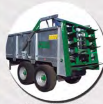
CAJA GALVANIZADA CAISSE GALVANISÉE