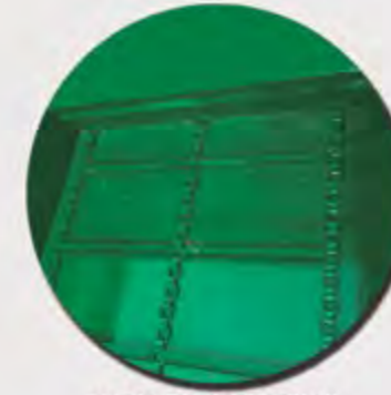
TAPIZ DE 3 CADENAS 3 CHAÎNES