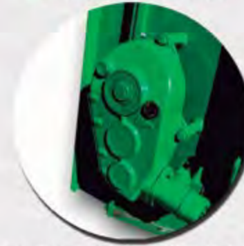
REDUCTOR Y MOTOR HIDRÁULICO RÉDUCTEUR ET MOTEUR HYDRAULIQUE