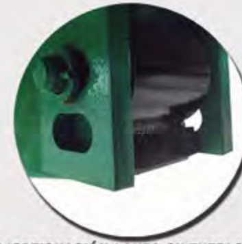
AMORTIGUACIÓN LANZA SILENTBLOK FLÈCHE À RESSORTS - TYPE SILENTBLOCK