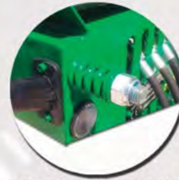
TENSOR DE CADENA DE MUELLES TENSEUR POUR LES CHAÎNES