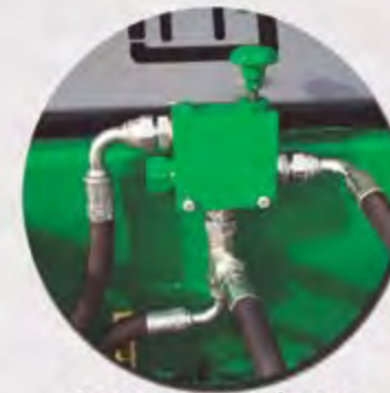
REGULADOR HIDRÁULICO RÉGULATEUR HYDRAULIQUE