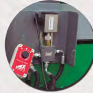
REGULADOR ELÉCTRICO RÉGULATEUR ÉLECTRIQUE