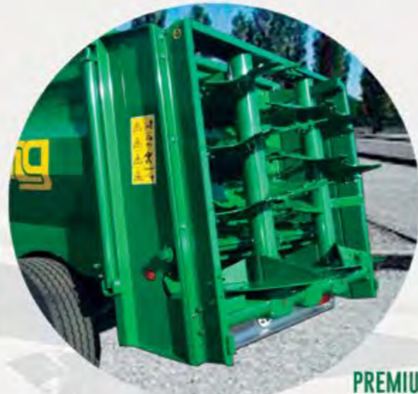
PREMIUM 90 ET 90 T