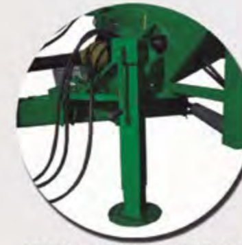
LANZA GIRATORIA HIDRÁULICA FLÈCHE HYDRAULIQUE GIRATOIRE