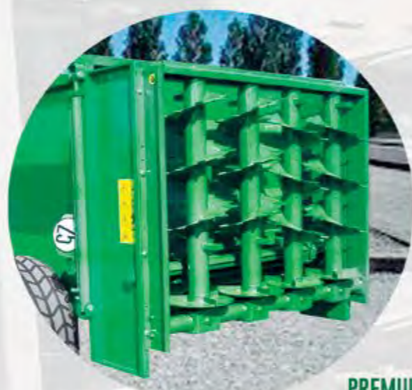
PREMIUM 90 ET 90 T

GRUPO DE RULO HORIZONTAL 1+1 GROUPE DE 1+1 HÉRISSEON HORIZONTAL