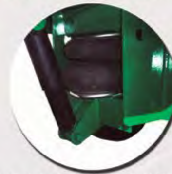
AMORTIGUACIÓN LANZA NEUMÁTICA FLÈCHE PNEUMATIQUE À RESSORTS