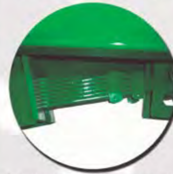
AMORTIGUACIÓN LANZA BALLESTA FLÈCHE À RESSORTS