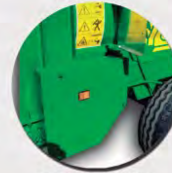
REDUCTOR MECÁNICO RÉDUCTEUR MÉCANIQUE