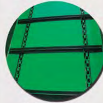
TAPIZ DE 2 CADENAS 2 CHAÎNES