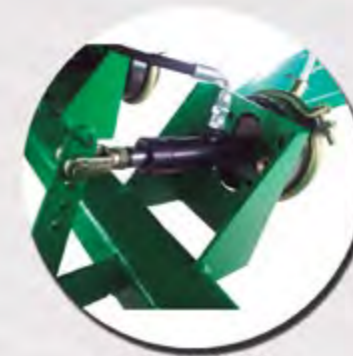
FRENO MIXTO FREINS MIXTES