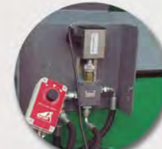
REGULADOR ELÉCTRICO RÉGULATEUR ÉLECTRIQUE