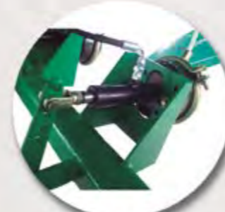
FRENO MIXTO FREIN MIXTE