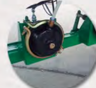
FRENO NEUMATICO FREIN PNEUMATIQUE