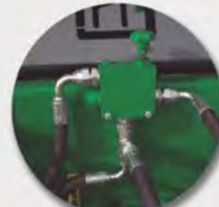
REGULADOR HIDRÁULICO RÉGULATEUR HYDRAULIQUE