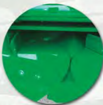
BANDEJA DE PLATOS Y PALAS ALTAS PLATEAUX ET PELLERES HAUTES