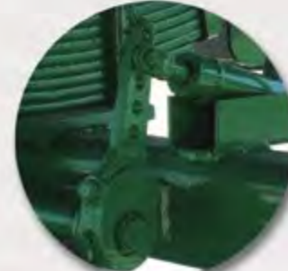
LEVAS REGULABLES CAMES REGLABLES