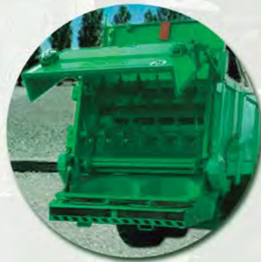
GRUPO ESPECIAL COMPOST 2 RULOS HORIZONTALES + 2 PLATOS SPECIAL GROUP FOR COMPOST 2 HORIZONTAL AUGER BEATERS AND 2 PLATES