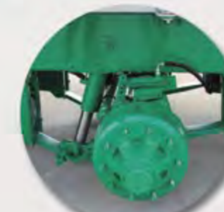
SUSPENSIÓN HIDRÁULICA SUSPENSION HYDRAULIQUE