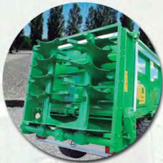
GRUPO DE 2 RULOS GROUPE DE 2 HÉRISSEMENTS