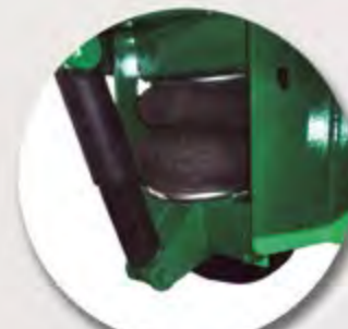
AMORTIGUACIÓN LANZA NEUMÁTICA FLÈCHE A RESSORTS PNEUMATIQUE