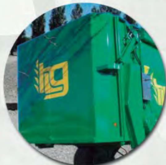
LIMITADOR COMPLETO DE ESPARCIDO LIMITEUR COMPLETE D'ÉPANDAGE