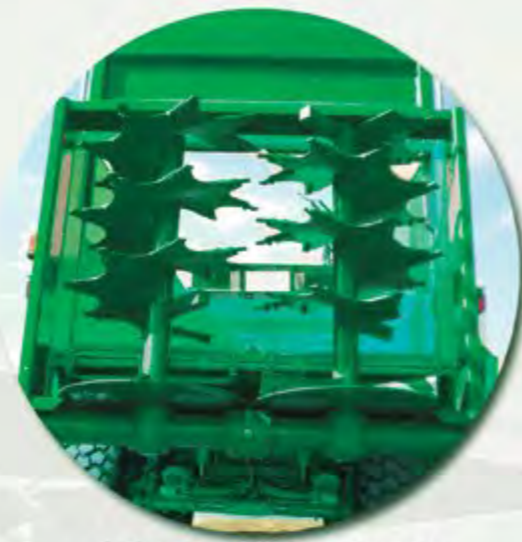
GRUPO DE 2 RULOS 1000 RPM GROUP OF 2 AUGER BEATERS 1000RPM