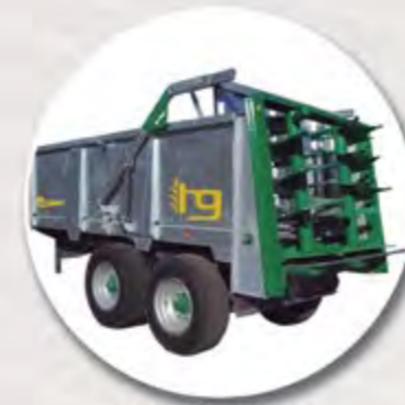
CAJA GALBANIZADA CAISSE GALVANISÉE