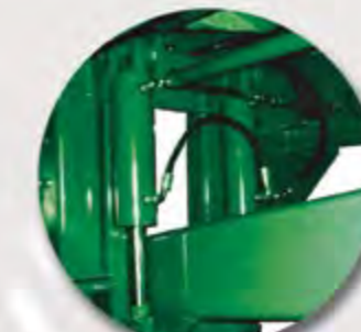
AMORTIGUACIÓN LANZA HIDRÁULICA FLÈCHE A RESSORTS HYDRAULIQUE