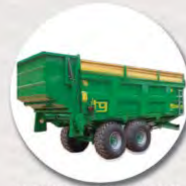
LATERALES CON PUERTA DE CESTA RIDELLES AVEC PORTE ARRIERE SPECIALE