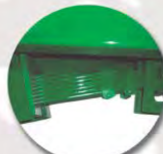
AMORTIGUACIÓN LANZA BALLESTA FLÈCHE A RESSORTS