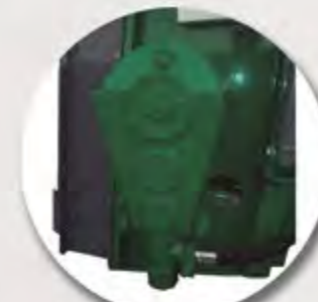
REDUCTOR Y MOTOR HIDRÁULICO RÉDUCTEUR ET MOTEUR HYDRAULIQUE